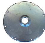
B-Schraubplatte für tragfähigen Beton