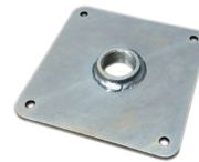
B-Schraubplatte für Robinson auf Treninsel