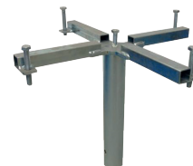
Z-Montagewerkzeug zur Ausrichtung Bodenhülse